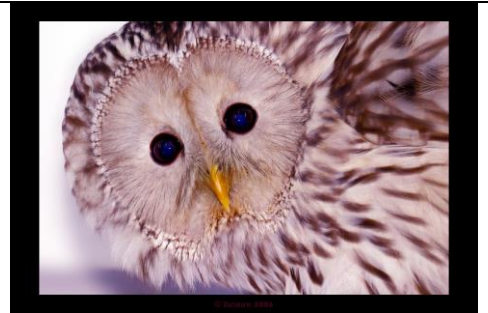
Chouette de Oural

Il existe deux sortes de créatures: celles matérielles perceptibles par les cinq sens, et celles spirituelles qui sont intelligibles sans existence extérieure. L'intelligence elle-même n'a pas d'existence extérieure.