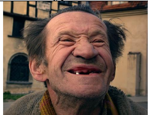
visage vieil homme.jpg

Cette liberté n'est accessible que si l'on accepte les plus cruelles vicissitudes, non pas avec une sombre résignation, mais avec un acquiescement radieux.