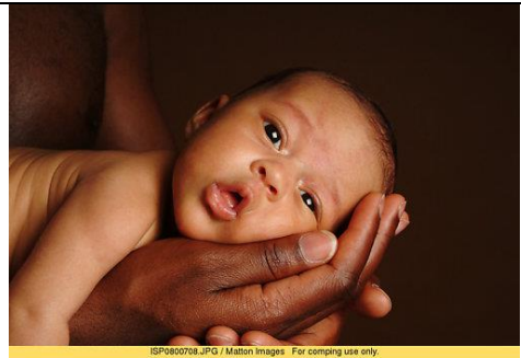
bebe creu main.jpg

Fais de mon amour ton trésor et chéris-le autant que tes propres yeux et que ta vie même.