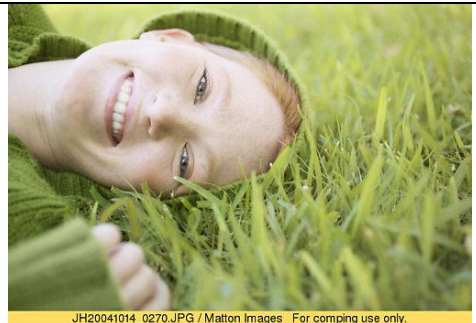
femme couchee pelouse.jpg

Ayant créé le monde et tout ce qui vit et s'y meut, Dieu a voulu conférer à l'homme la capacité de Le connaître et de L'aimer, dont l'exercice doit être regardé comme la raison d'être, la fin principale et dernière de toute la création.