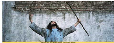
PAAC246001.JPG / Matton Images For comping use only. revolte pauvre.JPG

Ô Seigneur ! Rends-nous utiles dans ce monde; libère-nous de l'égoïsme et du désir. Rends-nous fermes dans ton amour et fais que nous aimions l'humanité entière.