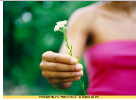
PAA21300042.JPG / Matton Images For comping use only. fleur tendue.JPG

L'établissement de la paix universelle n'est possible que par le pouvoir de la parole de Dieu.