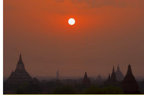
DP1789078.JPG / Matton Images For comping use only. aube temple hindou.JPG

Nous voici à l'aube de l'établissement de la paix universelle, et les premières lueurs de sa lumière sont déjà discernables.