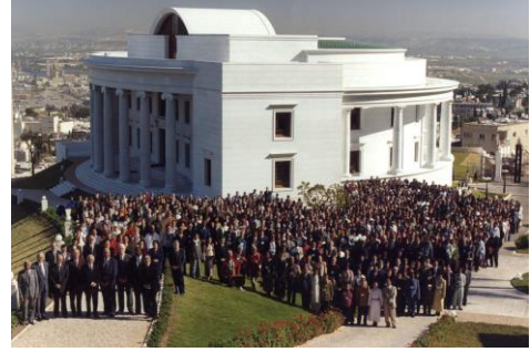
CIE conseiller et MUJ.jpg

Dans la mesure du possible, ne vous reposez pas un instant, allez du nord au sud du pays, conviez tous les hommes à l'unité du monde de l'humanité et à la paix universelle.