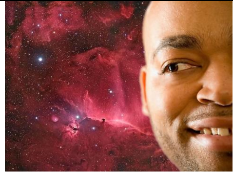
demi face homme couleur.JPG

Le temps est donc venu de promulguer la paix universelle, une paix basée sur la droiture et la justice, afin que l'humanité ne soit plus exposée à l'avenir, à d'autres dangers.